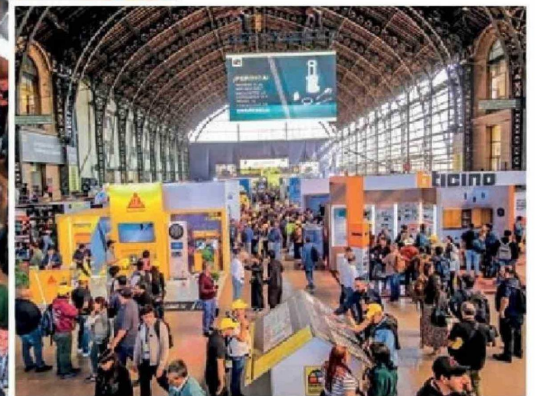
El encuentro de formación refleja un esfuerzo permanente de Sodimac a través del Círculo de Especialistas, que con 21 años hoy tiene más de 1.040.000 miembros.

La decimocuarta versión de la Gran Feria de Capacitación de Sodimac entregó más de 71 mil capacitaciones gratuitas en formato presencial y digital, superando las poco más de 60 mil de 2025, con foco en fortalecer la productividad y ejecución de proyectos en el sector construcción.