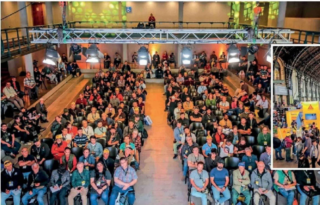
La Gran Feria de Capacitación reunió a cerca de 120 mil asistentes, entre presencial y online.

En su versión 14 y con una masiva asistencia, el encuentro formó gratuitamente a especialistas de la construcción en buenas prácticas y nuevas tecnologías para mejorar la productividad y la ejecución de proyectos en la industria, aportando a su reactivación. Esto se inserta en un esfuerzo permanente de Sodimac a través del Círculo de Especialistas.