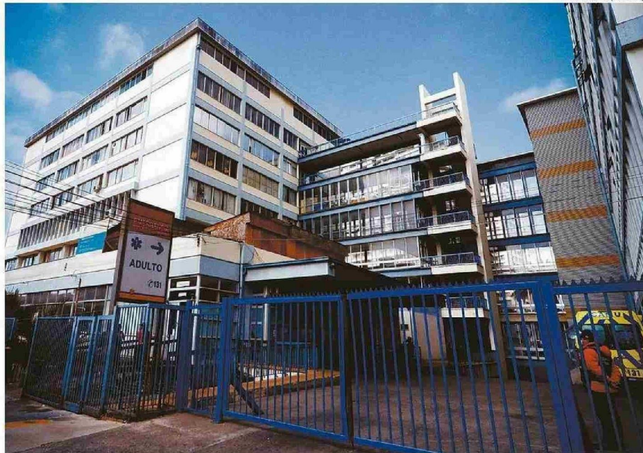
PROBLEMÁTICAS SE ESTARÍAN REGISTRANDO, ESENCIALMENTE, EN EL SERVICIO DE URGENCIAS DEL RECINTO ASISTENCIAL PORTUARIO.