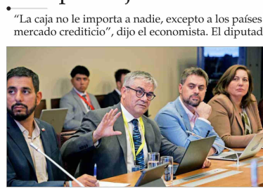
Mario Marcel ayer acudió como invitado a la comisión de Hacienda de la Cámara de Diputados.