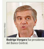
Rodrigo Vergara fue presidente del Banco Central.

■ Vergara: "Es difícil cuadrar el mono fiscal ante una baja de impuestos si no hay alguna compensación"