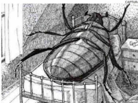
La novela "La metamorfosis", de Kafka, fue publicada en 1915.