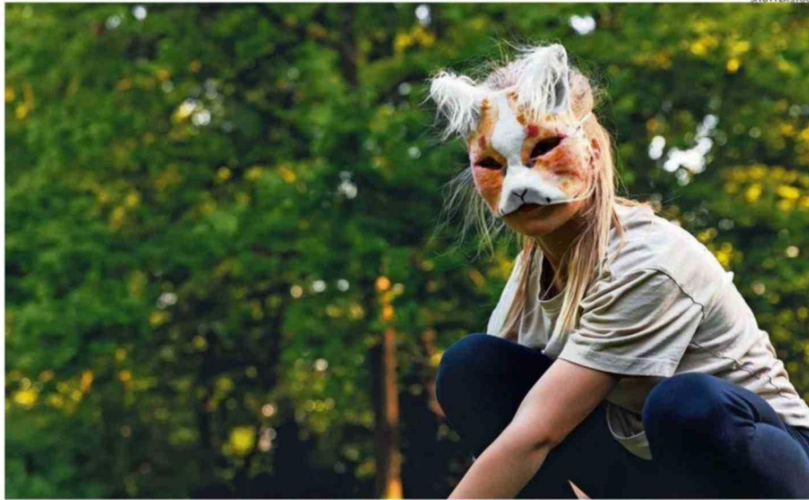
Los therians se caracterizan por usar máscaras de animales, peludas o con plumas, y colas, junto con desplazarse con pies y manos.

Esta carta "destierra un aliado oscuridad o bestia objetivo de tu cementerio. Luego, pon tantos contadores de alimento en aliados que controles como fuerza tenga el