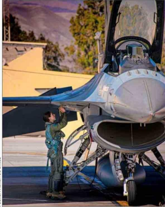
FUERZA AEREA DE CHILE

La teniente Caces en un F-16 MLU , su aeronave. Perteneció al Grupo de Aviación Número 8, de Antofagasta.