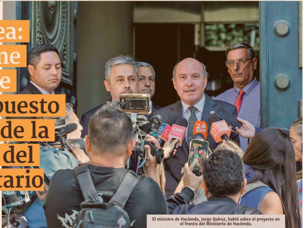
El ministro de Hacienda, Jorge Quiroz, habló sobre el proyecto en el frontis del Ministerio de Hacienda.

■ Hacienda también analiza una fórmula para que contribuyentes puedan retirar el saldo del FUT acumulado, para incentivar la inversión y aumentar la recaudación.