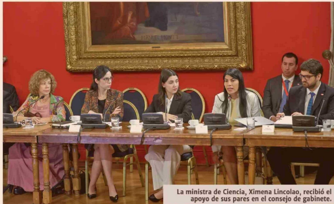
La ministra de Ciencia, Ximena Lincolao, recibió el apoyo de sus pares en el consejo de gabinete.

En paralelo, la reintegración del sistema tributario también sería gradual. Se está definiendo la fórmula aritmética para separar en