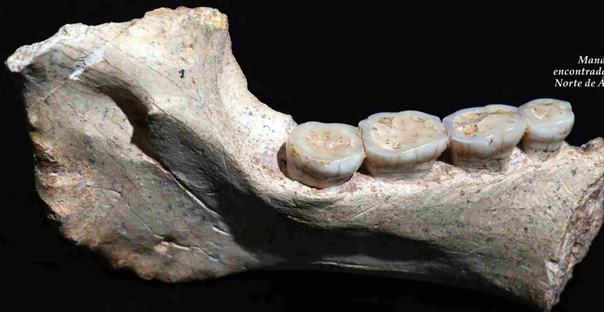
Mandíbula encontrada en el Norte de África.

El estudio sobre el origen de la humanidad siempre ha captado la atención e interés de la ciencia. Pruebas paleogenéticas sugieren que el último antepasado común de los humanos actuales —los neandertales y los denisovanos— vivió hace entre 765.000 y 550.000 años (ka), pero tanto la distribución geográfica como la morfología de estos humanos ancestrales siguen siendo inciertas.