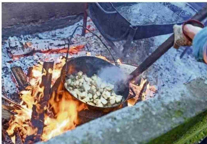
INSTANCIA CONTÓ CON RELATOS, MÚSICA, Y RICA GASTRONOMÍA CARMELINA.