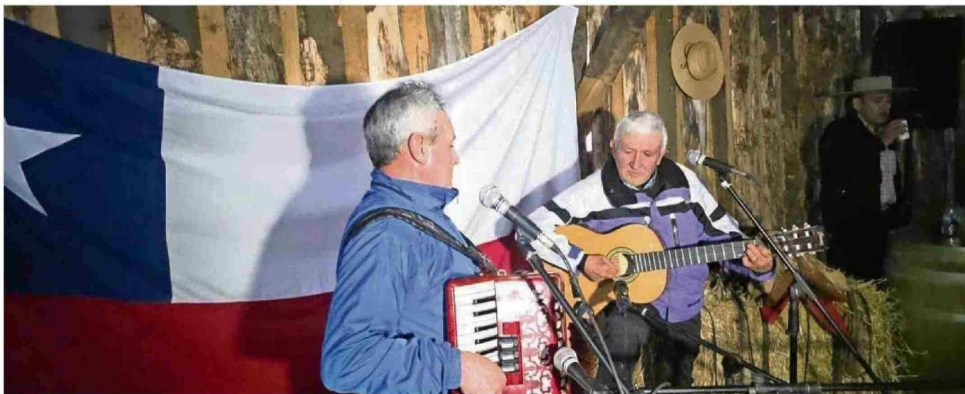
EN EL CAMPING PINCHEIRA MILLAR DE EL CARMEN SE REALIZÓ LA PRIMERA VERSIÓN DE LOS CUENTOS RURALES 2025, JORNADA LLENA DE TRADICIONES Y RESCATE DE NUESTRAS RAÍCES.