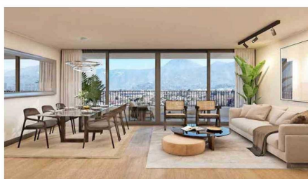
Living-comedor de proyecto Kennedy Norte, Vitacura.

Espacio Escondido fue concebido bajo el concepto de integrar comodidad, diseño contemporáneo y cercanía con servicios, centros educacionales, comercios y naturaleza. Esta tercera etapa viene a consolidar un proyecto que ha sabido responder a