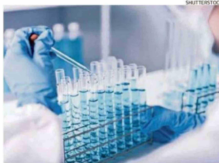
La vacuna espera superar los tratamientos convencionales.

“Las vacunas terapéuticas han abierto un nuevo horizonte de esperanza en la lucha contra el cáncer.”