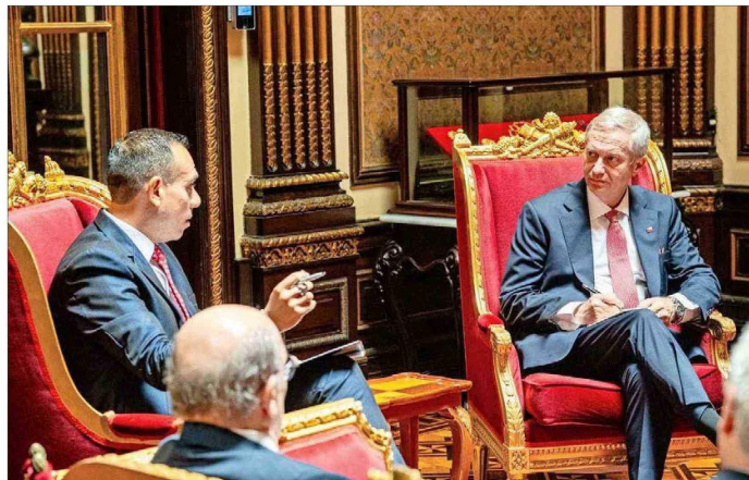
El Presidente de Perú, José Jerí, durante su reunión bilateral con el mandatario electo chileno, José Antonio Kast, ayer, en el Palacio Pizarro. Jerí abogó por el funcionamiento del gabinete binacional a contar de marzo.

"Les hemos señalado a los inmigrantes irregulares que les quedan, en este día, 63 días para dejar nuestro país y volver con todos sus papeles en regla". Y