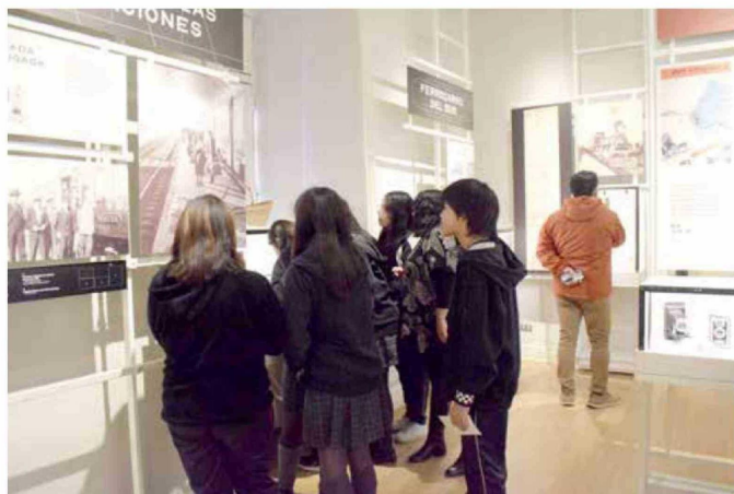
Sumado a la presencia del Abate, los alumnos participaron del recorrido del museo, en una lúdica salida a terreno.

muy participativa al permitir la interacción entre los jóvenes y el Abate Juan Ignacio Molina, quienes rápidamente adoptaron el espíritu del Día del Libro, compartiendo sus dudas, además de sus vivencias personales en el museo.