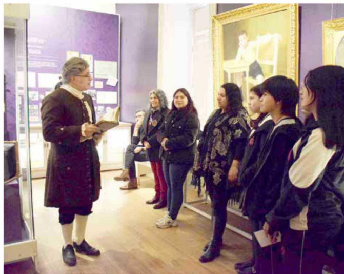
Alumnos del Colegio Juan Ignacio Molina compartieron con el prócer en primera persona.

Título: Con representación de Juan Ignacio Molina, Museo O'Higginiano conmemora Día del Libro