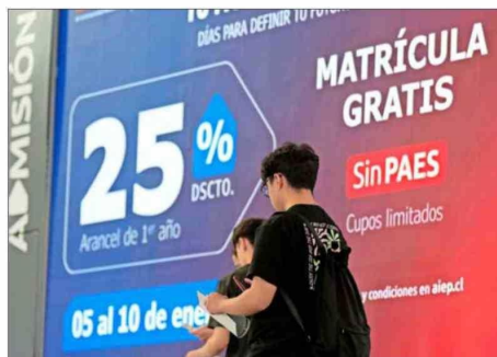
La gratuidad se otorga a quienes acrediten pertenecer al 60% más vulnerable de la población. Más de 625 mil personas estudian hoy con el beneficio.

También destaca que "la mayor parte de esta información proviene de registros administrativos que no dependen de lo que el postulante declara, lo que le otorga al modelo una objetividad que los mecanismos anteriores no tenían".