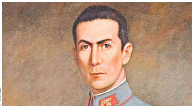
General Ramón Cañas Montalva es uno de los pensadores más importantes en la historia de nuestro país.