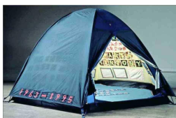
"La carpa" de Tracey Emin. Ahora en Tate Modern.

Ocho muestras de arte imprescindibles para ver este 2026 E 6