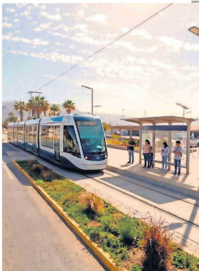
EL TREN URBANO EN ANTOFAGASTA ES UNA DE LAS INICIATIVAS CONSIDERADA A MEDIANO PLAZO EN EMRA.

“Creo que cualquier iniciativa que esté dentro de ese marco es positiva. Pero creo que también se debe empezar a observar bien la región, para ver las necesidades de todas las comunas y que no solo apunten a lo que podrían decir los gobiernos regionales o los municipios, que sean obras que realmente impulsen el desarrollo y el crecimiento”, declara. CS