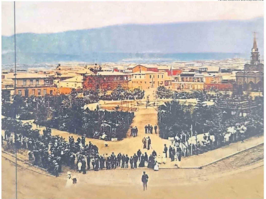
ESTE ERA EL ASPECTO QUE TENÍA PLAZA EN 1906, PARADÓJICAMENTE LA IGLESIA QUE APARECE SE INCENDIÓ EN NOVIEMBRE DE ESE AÑO.

Este aspecto también es importante considerarlo ya que publicaciones de carácter ideológico que se realizaron décadas después de la masacre, incluso indicaban que hubo hasta 500 muertos.