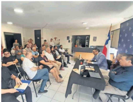
LA PRESENTACIÓN DE LA OBRA SE REALIZÓ EL DÍA DE AYER.

A 120 años de la tragedia, se publicó el primer libro que aborda este hecho de manera académica, dilucidando aspectos desconocidos de este suceso ocurrido el 6 de febrero de 1906.