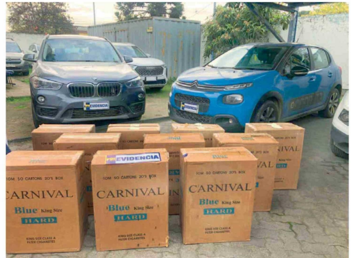
La PDI decomisó un gran cargamento de cigarrillos que se pretendía vender en el Maule.