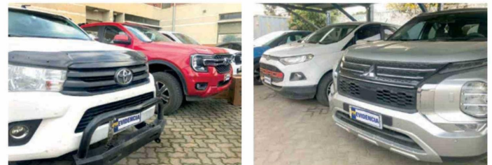
Los vehículos incautados fueron adquiridos con ganancias del delito de contrabando.