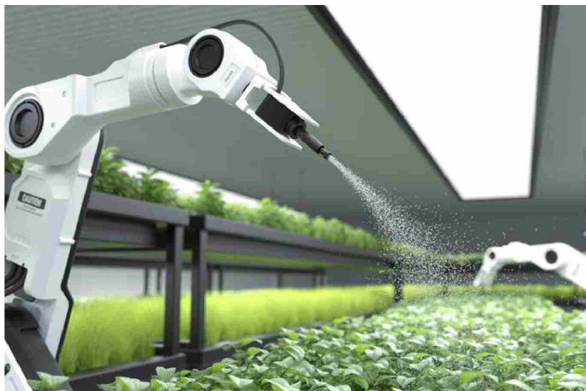
Los softwares de IA hoy permiten programar acciones críticas para la agroindustria, como el riego de precisión y el uso adecuado de recursos naturales.

Tiraje: Lectoría: Sin Datos Favorabilidad: No Definida