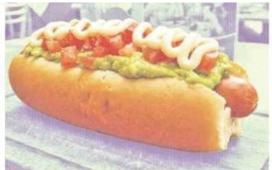
El completo obtuvo una puntuación de 4,2 sobre 5, compartiendo el primer lugar regional con el choripán argentino-uruguayo.