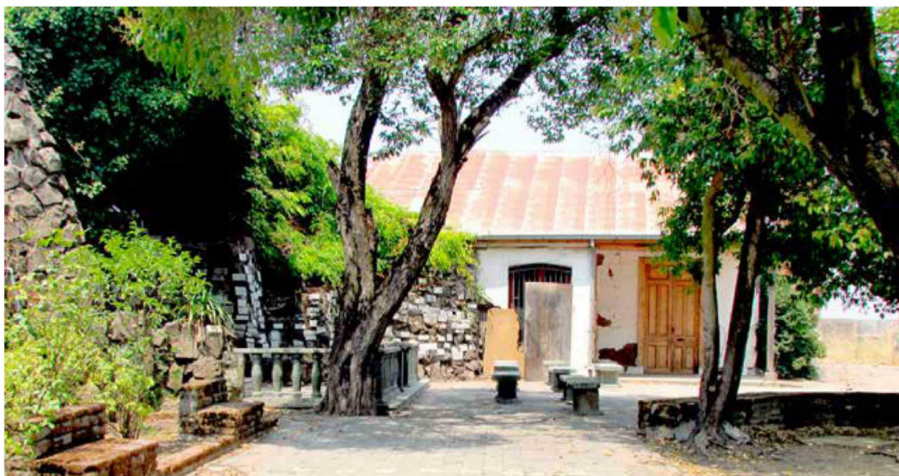
La gruta de San Francisco aún permanece al servicio de los curicanos.