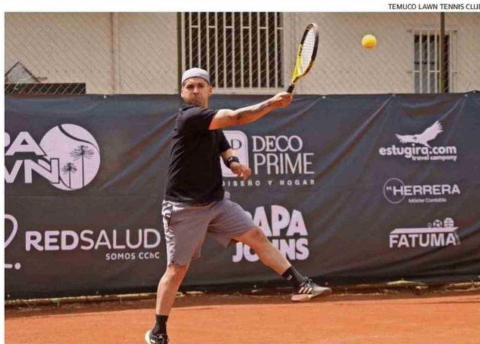
EN LAS CANCHAS DEL TEMUCO LAWN TENNIS CLUB SE VIVIRÁ LA SÉPTIMA FECHA DEL CIRCUITO.