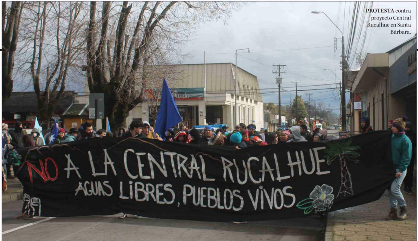
PROTESTA contra proyecto Central Rucalhue en Santa Bárbara.

en mano de obra demandada, en viajes realizados, en emisiones y/o residuos generados”.