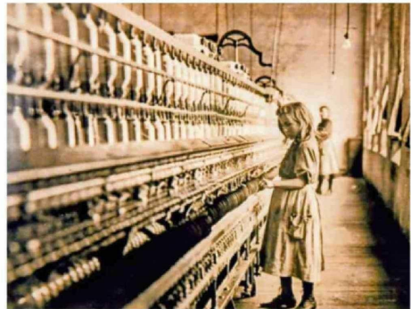
LAS IMÁGENES QUE SE EXHIBEN DESDE AYER EN EL CENTRO CULTURAL EL AUSTRAL PROVIENEN DEL ARCHIVO CENTRAL SALESIANO DE ROMA, EN ITALIA Y DEL PROGRAMA DE CONTENIDO ABIERTO DE GETTY.