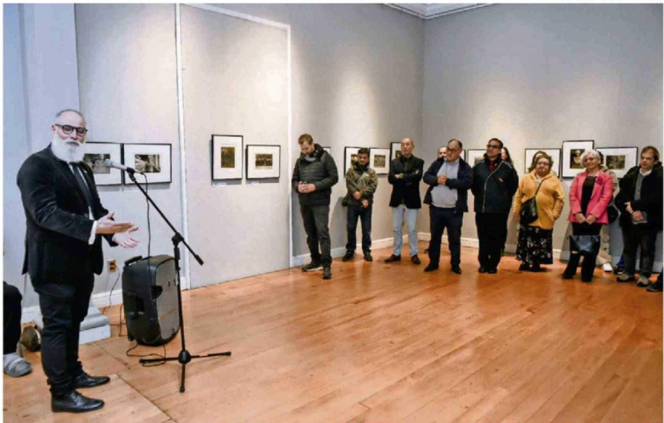
FRANCISCO ROSA, DEL ARCHIVO FOTOGRAFICO DEL ISV, INVITÓ A LA COMUNIDAD A CONOCER ESTAS OBRAS Y REFLEXIONAR SOBRE LA INFANCIA.

das del ISV y los organizadores invitaron a la comunidad a visitar la exposición, que estará abierta hasta el 20 de junio, de martes a viernes, entre las 14.30 y las 17.15 horas. CS