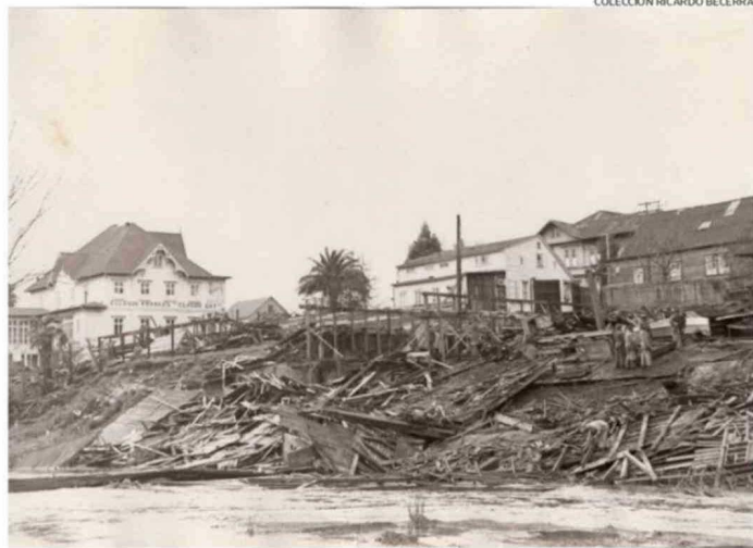
DAÑOS EN LA CIUDAD DE OSORNO, RIBERA DEL RÍO DAMAS.

“Esto representa una complejidad que debe ser abordada previo a la activación de situaciones que generen emergencias tales como terremotos o erupciones volcánicas”, concluyó el también máster en Gestión y Reducción del Riesgo de Desastres y Catástrofes. CS