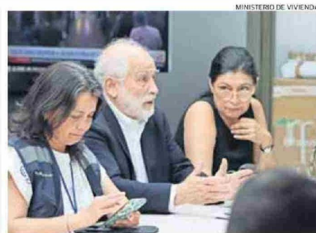
MONTES PARTICIPÓ EN REUNIONES DE COORDINACIÓN EN BIOBÍO.