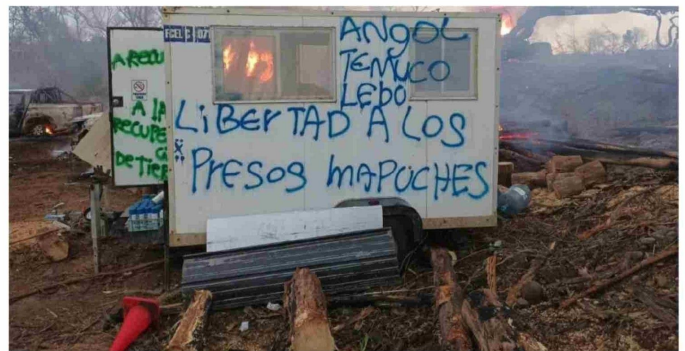
LOS ALCALDES DE MULCHÉN y Santa Bárbara dijeron que se debe trabajar en conjunto para evitar que se expandan los "actos terroristas".

las autoridades de Gobierno a estar donde pasan los hechos, "junto a nuestro alcalde y vecinos, porque es aquí donde nuestra gente quiere el respaldo del Estado, quiere el respaldo de nuestros parlamentarios, de nuestro gobierno, y de todas las instituciones que participan en la seguridad".