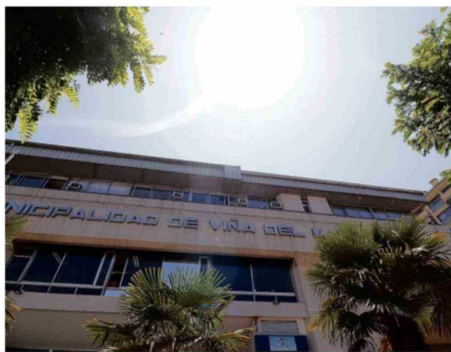
CORPORACIÓN DE VIÑA DEL MAR ES LA QUE POSEE MÁS CASOS.