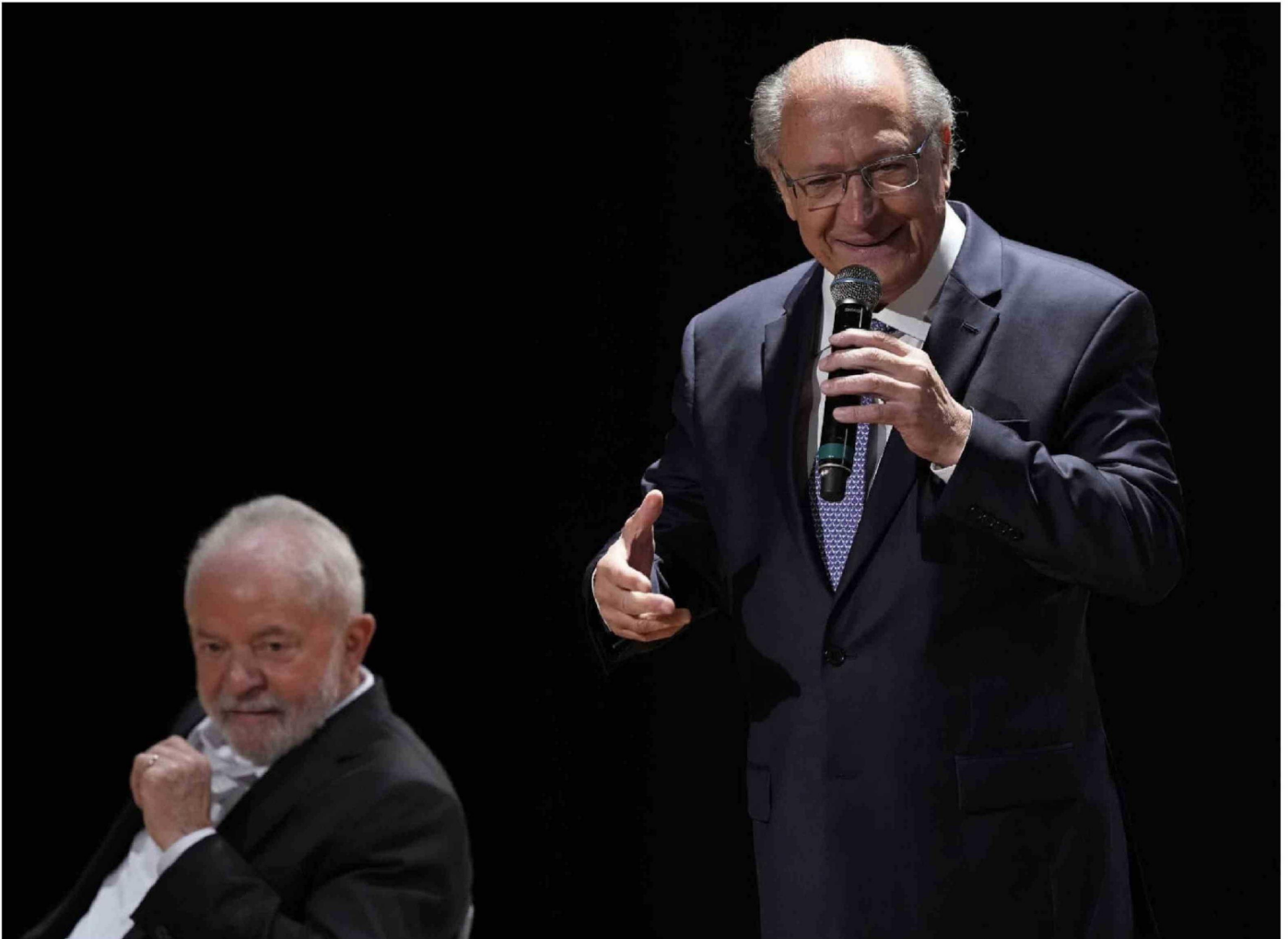
► El presidente Luiz Inácio Lula da Silva y su compañero de fórmula Geraldo Alckmin en Brasilia, el 10 de noviembre de 2022.