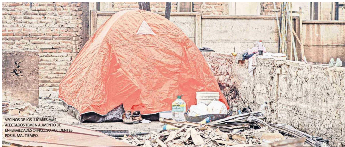
VECINOS DE LOS LUGARES MÁS AFECTADOS TEMEN AUMENTO DE ENFERMEDADES O INCLUSO ACCIDENTES POR EL MAL TIEMPO.

Tiraje: 11.200 Lectoría: 46.615 Favorabilidad: No Definida