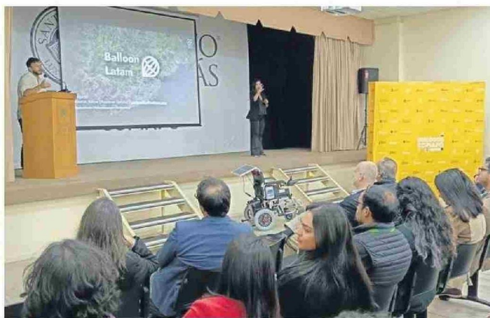
DIÁLOGOS COPIAPÓ EN SU SEGUNDO CICLO.

"Se necesita más que políticas de Gobierno, políticas, en este caso de Estado, que trasciendan los tipos de administración. Los que están hoy día, ponerse al servicio y hacer una hoja de ruta con las distintas partes, no hablo de un partido o un lado, aquí ne-