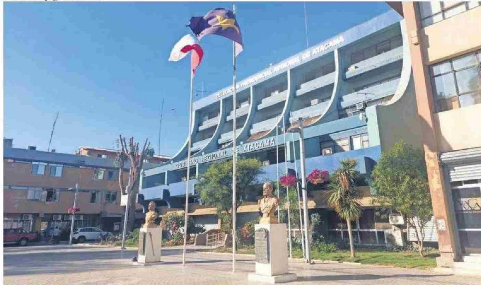
IDENTIDAD Y PERTENENCIA ES UN FACTOR CLAVE PARA IMPULSAR EL DESARROLLO.