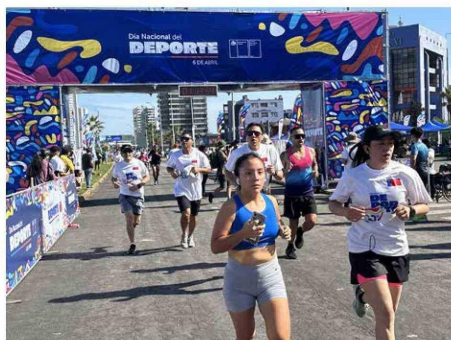
La corrida se desarrolló por avenida Arturo Prat en el sector de Playa Brava.

Es así como, en este espacio del Día del Deporte, los asistentes pudieron disfrutar del deporte y de las atenciones de diversos servicios públicos, quienes respondieron consultas de los asistentes. Además, el Ministerio de Salud, pudo ofrecer su campaña de vacunación de este invierno, la cual fue todo un éxito. El Día del Deporte 2025 reafirma el compromiso del Estado con una política pública que pone al deporte en el centro de la vida de las personas, como motor de salud, convivencia, equidad y desarrollo humano.