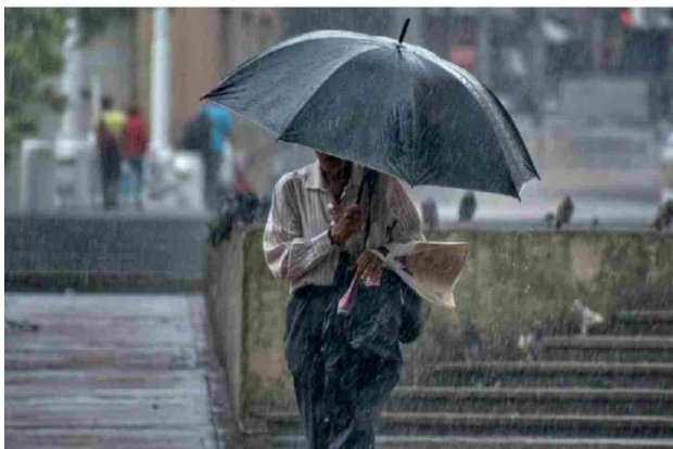
EN LAS LLUVIAS, SE ESPERA un repunte progresivo de las temperaturas a lo largo del día y el domingo.

Los Angeles experimentará un cambio abrupto en las condiciones meteorológicas este viernes, cuando una baja segregada en altura aporte aire más frío e inestable a la zona centro-sur. El sistema podría traducirse en lluvias acompañadas de tormentas eléctricas, principalmente durante la tarde y la noche, según el pronóstico de Meteorología.