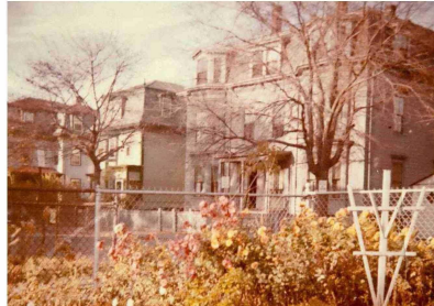
A Olga le gustaba retratar paisajes. Este es un conjunto habitacional de Estados Unidos, donde vivieron cuando Humberto estudió en el MIT.

POR AMANDA MARTON RAMACIOTTI