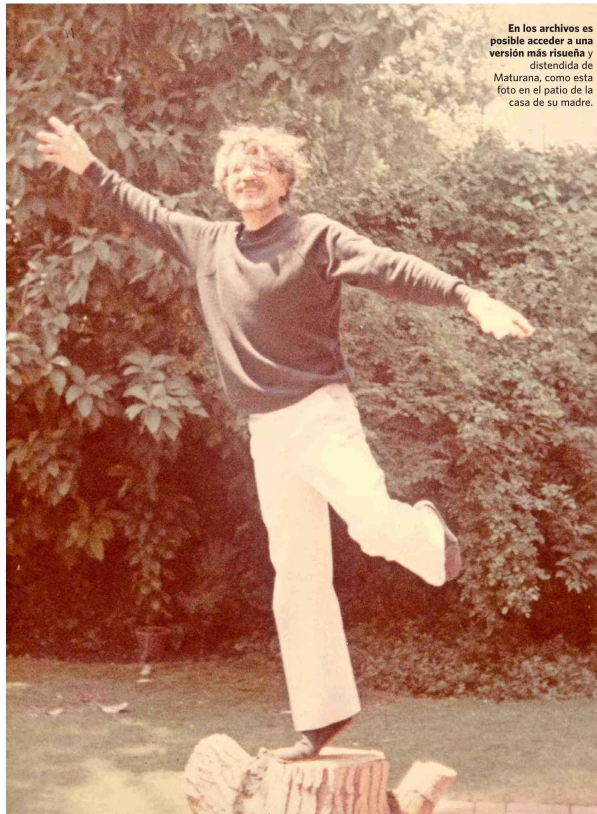
En los archivos es posible acceder a una versión más risueña y distendida de Maturana como esta foto en el patio de la casa de su madre.