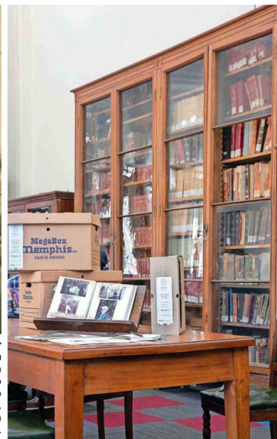
Las tres cajas con documentos familiares están disponibles para el público en el Archivo Nacional.

Además, trataban siempre de apoyar en la casa. De niños, can-