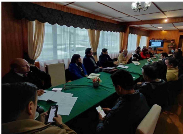
REUNIÓN CONVOCADA POR CARABINEROS CON DIRECTIVOS DE PLANTELES DE CASTRO.