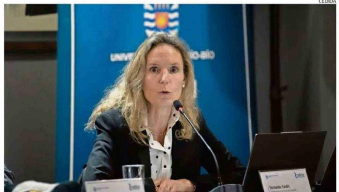
CONTÓ CON LA PARTICIPACIÓN DE LA SUBSECRETARIA DE EDUCACIÓN SUPERIOR, FERNANDA VALDÉS.

Asimismo, valoró especialmente la realización de las sesiones del Cruch en regiones, destacando el significado de que el encuentro se desarrolle en la Universidad del Bío-Bío. "Estamos muy contentos de estar acá. Para nosotros es fundamental desplegarlos en terreno, conocer las instituciones y sus comunidades, porque eso permite comprender mejor la complejidad y particularidades de cada proyecto universitario", indicó.