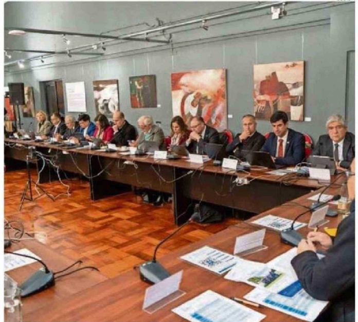
SE DESARROLLÓ LA SESIÓN 671 EN LA UNIVERSIDAD DEL BÍO BÍO.

En esa línea, relevó que la agenda de trabajo considera tanto temas inmediatos como aquellos vinculados a la sostenibilidad del sistema y la actualización de la oferta formativa. "Hoy existen desafíos relevantes, pero también la necesidad de proyectar cambios que permitan responder a nuevas demandas, lo que hace fundamental generar estos espacios de diálogo", afirmó.