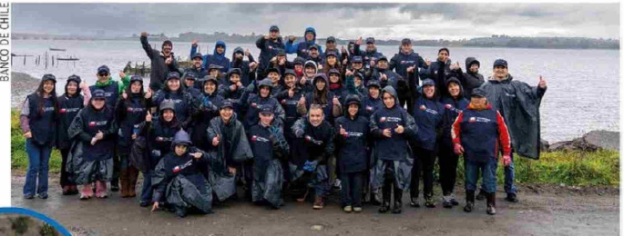
BANCO DE CHILE

Desde su creación, en 2022, la Cuadrilla Azul de Banco de Chile ha centrado sus esfuerzos en la recuperación de espacios naturales afectados por la contaminación. Este año, la iniciativa dio un paso adicional, fortaleciendo su dimensión educativa como un elemento