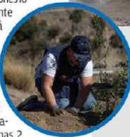
En la ribera del estero El Sauce, en San José de Maipo, se realizaron trabajos de reforestación.