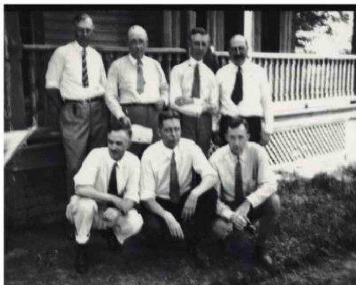
La Ley Butler no fue derogada hasta 1967, pero el juicio de Scopes sentó un precedente clave en la defensa de la enseñanza de la evolución y la laicidad escolar en Estados Unidos. En la foto, los científicos que apoyaron al docente acusado