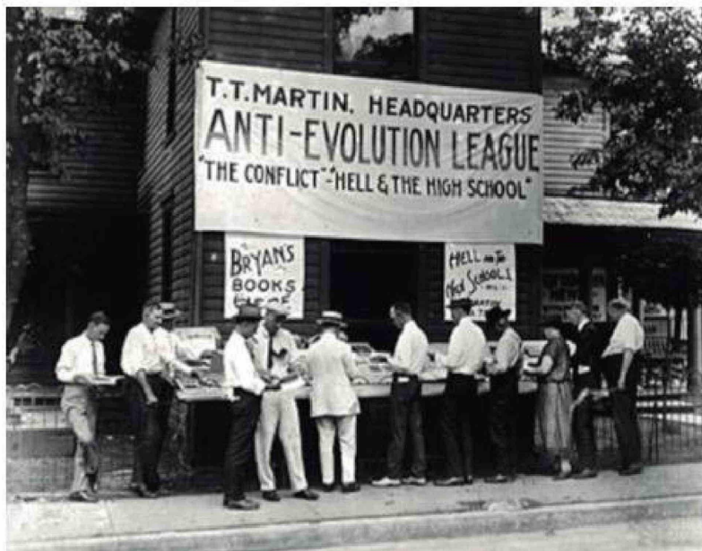
La Ley Butler, aprobada en Tennessee en 1925, prohibió la enseñanza de cualquier teoría que negara la Creación Divina según la Biblia en instituciones públicas.

Tiraje: 5.200 Lectoría: 15.600 Favorabilidad: No Definida