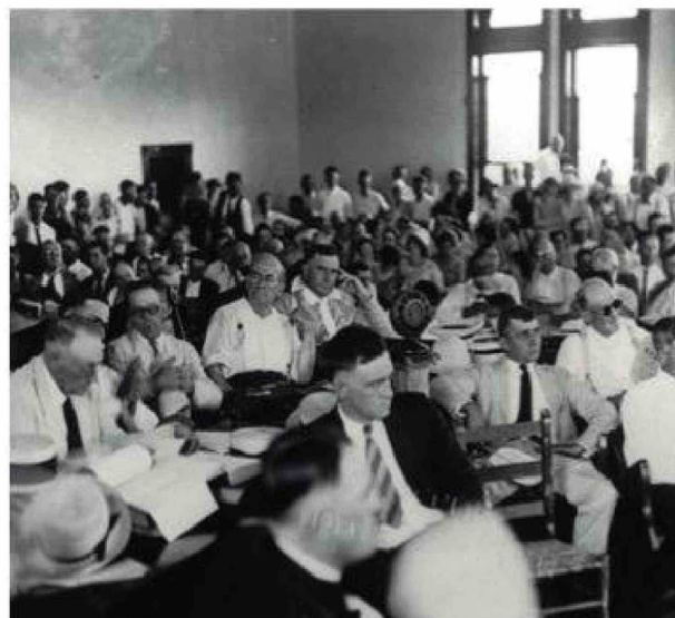
El juicio atrajo la atención mediática con la cobertura de cientos de periodistas y la transmisión en directo por radio, convirtiéndose en un evento histórico para la prensa de Estados Unidos.