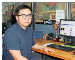
Ignacio Torres, Deportes Emol.