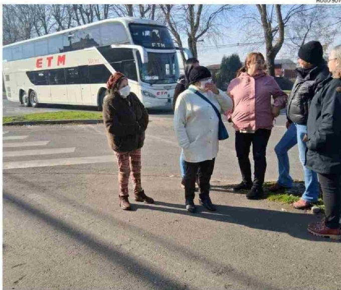
DIRIGENTES Y VECINAS DE LOS TRAPIALES, EN LA INTERSECCIÓN DE EL PORTAL CON RUDECINDO ORTEGA, LUGAR DONDE DEBERÍA UBICARSE EL SEMÁFORO TAN ANHELO.