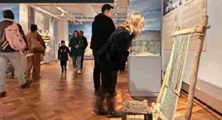
Museo de La Araucanía

Textilería basada en el tradicional telar mapuche. Piezas arqueológicas, etnográficas y documentales de pueblos originarios, además de un wamp o canoa de laurel y alfarería de entre el 200 y el 1500 d.C., son parte de los casi 500 objetos patrimoniales exhibidos en el Museo Regional de La Araucanía, que ayer recibió la visita de cientos de asistentes, quienes además pudieron participar de charlas informativas y de una feria con productos rurales.