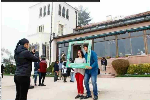
Palacio Presidencial, Cerro Castillo

El Palacio Presidencial de Cerro Castillo fue uno de los sitios más visitados ayer en la Ciudad Jardín. El edificio está ubicado en la parte alta del cerro y fue construido en 1929, como residencia de descanso de los presidentes. Durante la mañana, los visitantes esperaron pacientemente su turno para entrar y conocer parte del inmueble de tres pisos, con vista al mar. En el recorrido pudieron conocer el hall de acceso, el living, el escritorio del jefe de Estado, el comedor y los amplios jardines, y tomar fotos con el palacio a sus espaldas.