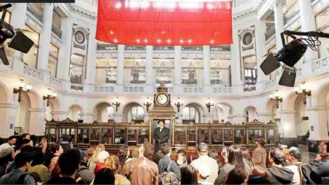
Banco de Chile

La Casa Matriz del Banco de Chile nuevamente abrió sus puertas al público con emocionantes puestas en escena de los hitos más relevantes del banco. Los visitantes también pudieron aprender sobre la relevancia de la entidad financiera, con momentos como la construcción de la Casa Matriz o la primera Teletón en 1978.