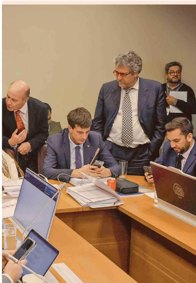
El ministro Jorge Quiroz se desplegó en la comisión de Hacienda para explicar las modificaciones principales.

intensificaron sus acercamientos con bancadas oficialistas y aquellas con las que han estado negociando para asegurar sus votos, como la bancada DC-FRVS.