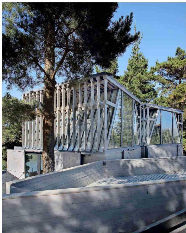
Vista de la fachada hacia la calle. Se eligió un gris topo que cambia según la luz del día.