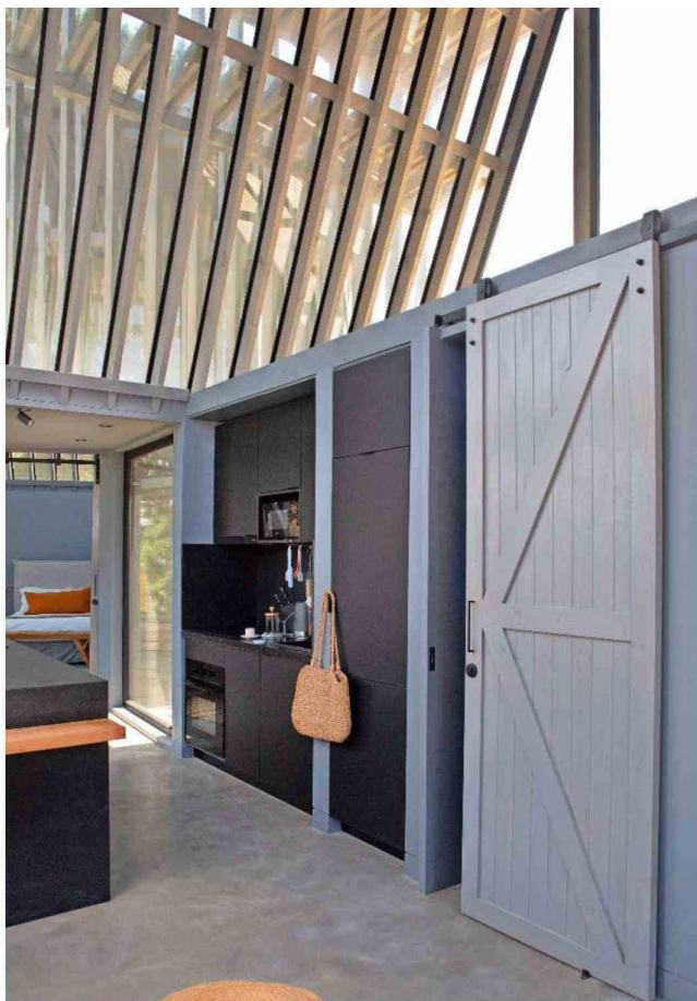
Todas las puertas son tipo granero. Arriba, el espacio de uno de los altillos.

Tiraje: 126.654 Lectoría: 320.543 Favorabilidad: No Definida