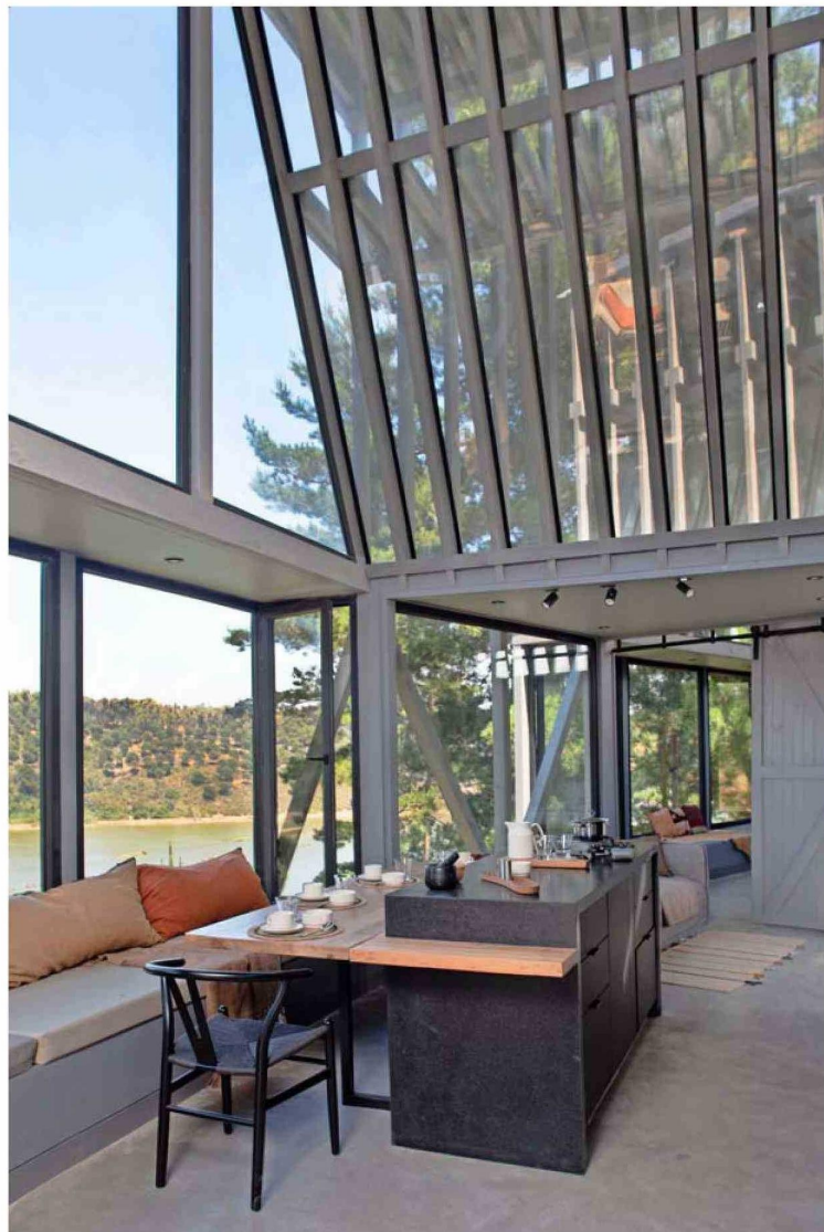
El mesón de la cocina tiene una mesa abatible para dar forma al comedor.

Una vez que escogió el terreno, prácticamente dentro de un bosque y con vista cercana al estero, conoció al arquitecto Sebastián Irrarrazaval (@sirarrazaval) y la conexión fue inmediata. Bastó un café y una conversación para darse cuenta de que él era el indicado para diseñar su nueva vivienda. Además, su obra le parecía excepcional, en especial la Biblioteca de Constitución. "Lo primero que le dije fue que no quería esas casas como cajones negros que hay en Punta de Lobos", señala. Y, por supuesto, el resultado es absolutamente distinto y, de cierta manera, hace un guiño a la biblioteca.