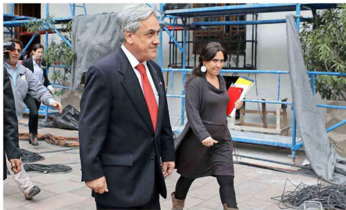
"Me encantaba trabajar con mi papá y me encantaba la política, pero siempre en un segundo lugar", dice.