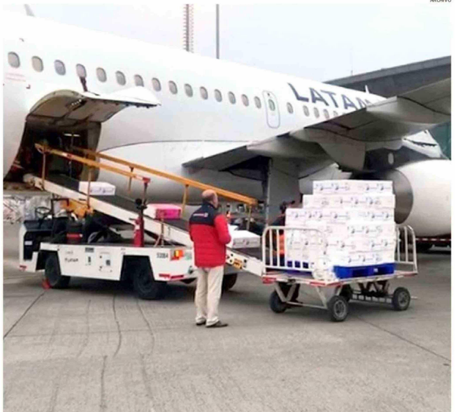
LAS EXPORTACIONES DE SALMÓN CONTRIBUYERON EN FORMA IMPORTANTE A EMPUJAR EL CRECIMIENTO ECONÓMICO DE LA REGIÓN DE LOS LAGOS.

Otro ítem que consideró este reporte del Banco Central es el de exportaciones regionales de bienes y servicios, índice