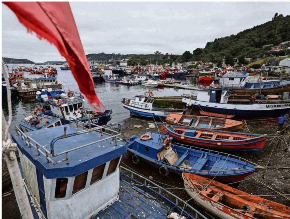
LA ACTIVIDAD PESQUERA TAMBIÉN CONTRIBUYÓ PARA ALCANZAR EL 5,3% DE CRECIMIENTO EN LA ECONOMÍA DE LA REGIÓN DE LOS LAGOS.