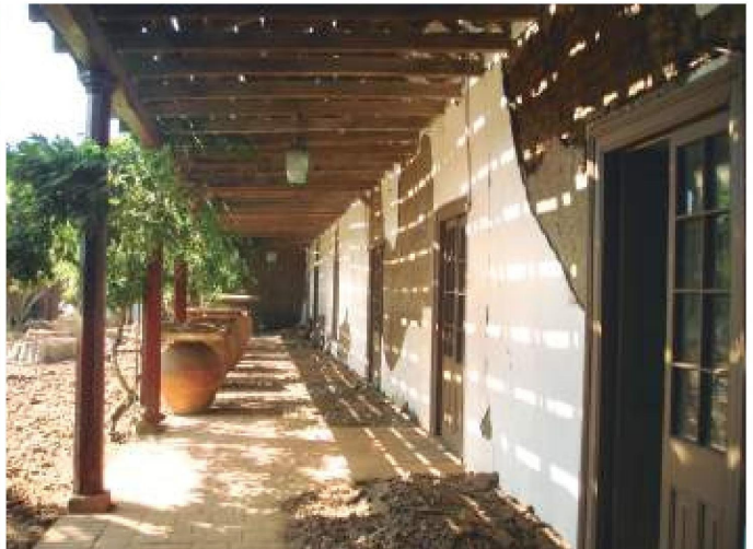
Vistas de diferentes partes de la casona que muestran los daños provocados por el terremoto de 2010. La techumbre fue repuesta por completo.