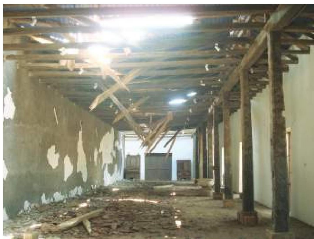
Sala Museo de Arte Religioso, el sector más afectado por el terremoto.

Encargado por licitación pública a Consultores Epsilon Ltda., la propuesta se enfocó en recuperar, potenciar y consolidar un espacio patrimonial trascendente y representativo de la memoria y tradiciones de la Región del Maule.