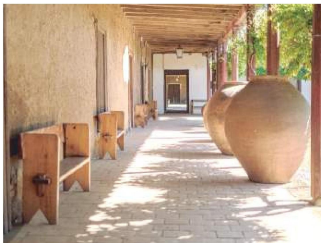
Estado de corredores y patios de la casona al día de hoy.