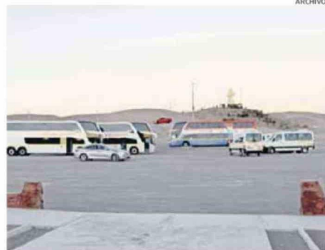
CONCEJALES ACUSAN QUE EMPRESAS NO CUENTAN CON TERMINALES.

“Municipios como el de Caldera, Copiapó e Iquique, plantearon lo mismo tras la visita de Amunochi al Congreso. En este sentido la senadora Yasna Provoste comprometió