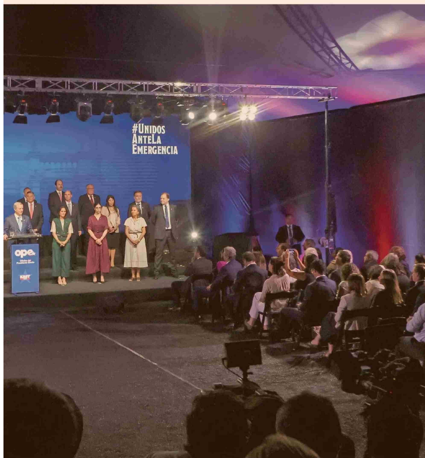
El Presidente electo junto con su gabinete de 24 ministros, en la sede de la OPE en calle La Gloria, en Las Condes.