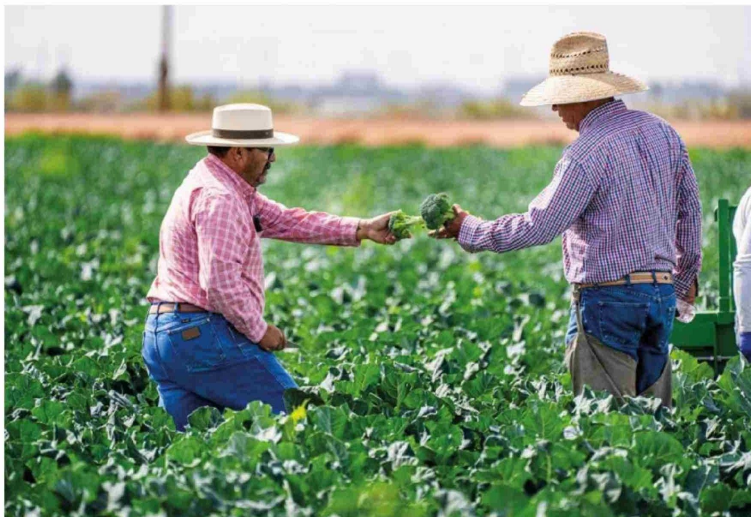
LA REGULARIZACIÓN DE LA ENTRADA de trabajadores migrantes a Chile permite al país avanzar en formalidad y seguridad, a la vez que aporta al sector productor agrícola nacional.

"Promover el ingreso regular y seguro de trabajadores migrantes no solo aporta al sector, sino que también permite avanzar en formalidad y seguridad para el país", añadió