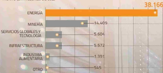
CARTERA DE INVESTCHILE POR SECTOR MONTO (EN MILLONES DE US$)