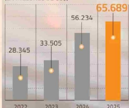
EVOLUCIÓN CARTERA DE INVERSIONES EN CHILE (EN MILLONES DE US$)